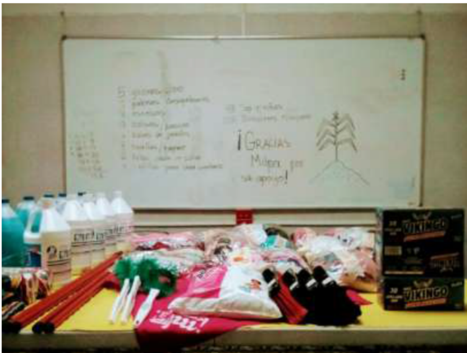
Agradecimiento a MILPA

Hoy en día, organizaciones de la sociedad civil y voluntariado, así como la iglesia católica continúan en el apoyo directo a las comunidades y personas afectadas por la tragedia.