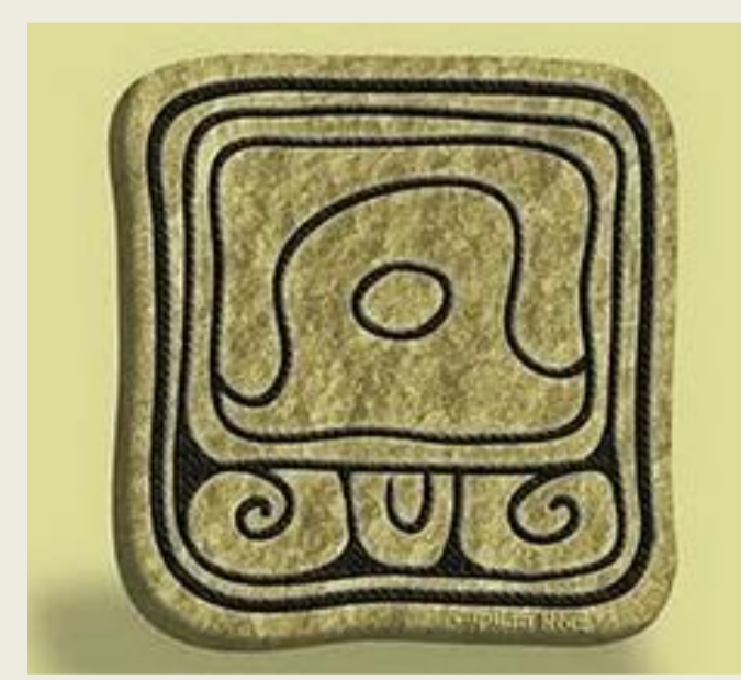
Glifo Maya de la LUNA