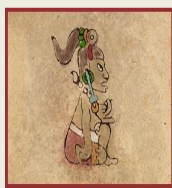
Diosa Maya Ixchel

Fuentes: aWDI, bMarques, 2003, and World Bank (2001) Social Safety Nets in Latin America and the Caribbean: Preparing for Crisis, cGuatemala, ENSMI 2002, Nicaragua, DHS 2001, El Salvador, FESAL 1998, Honduras, CDC 2001, Panamá, ENV, 1997, d CIEN para gasto público en educación, gasto público en protección social, y todos los indicadores de educación, únicamente asistencia social (World Bank (2000) Panamá - Poverty Assessment), fLoening, 2003, gDe Ferranti, et al., 2003, aWorld Bank, Edstats (2000).