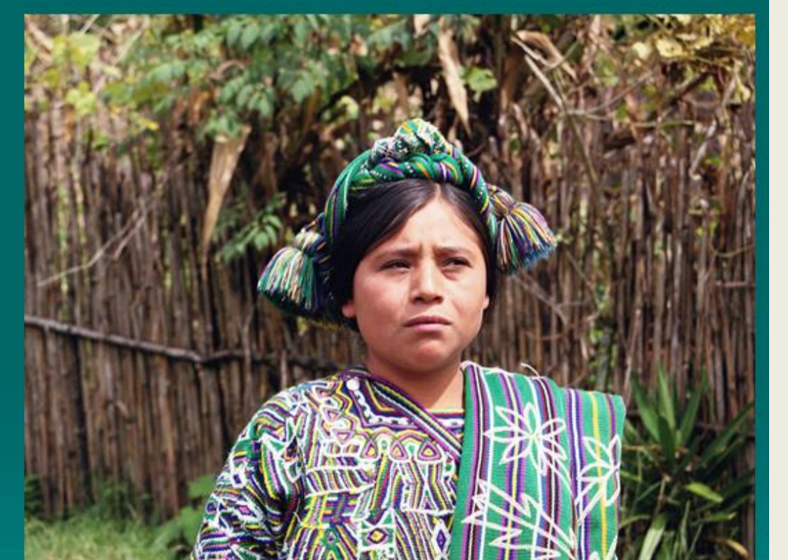
Kit, Turansa, zona Ixil