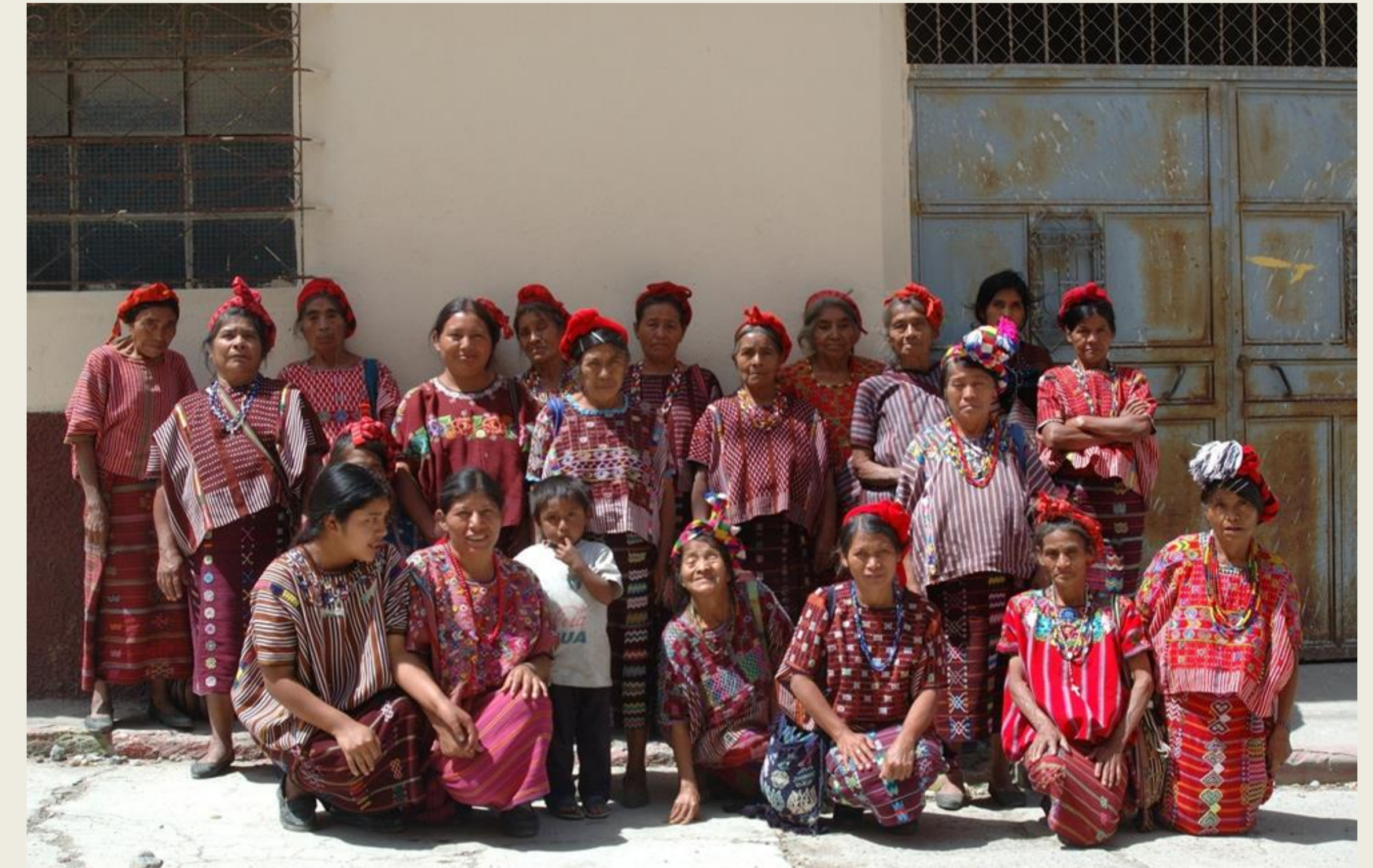
Comadronas de zona Mam, tras curso de capacitación